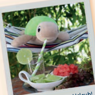
Sooo, ein schöner Urlaub!