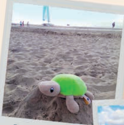
Endlich am Strand!